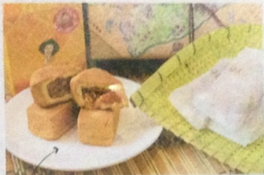
吃土鳳梨酥，品味八卦山四季酸甜。