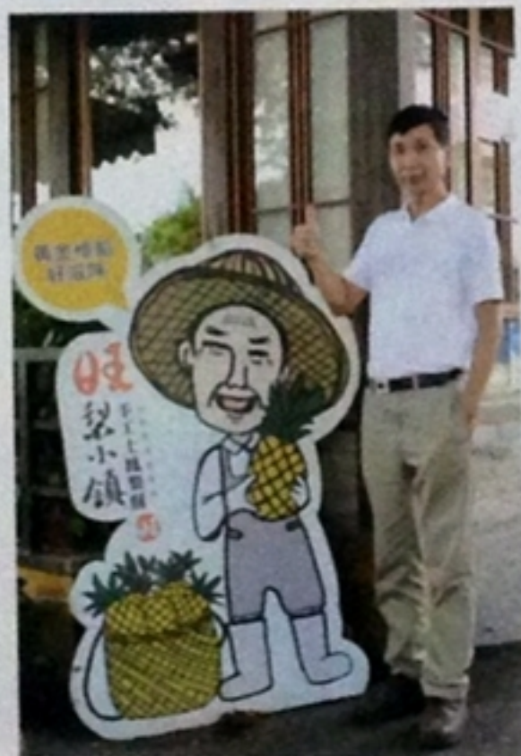
▼藍優盡為八卦山土鳳梨另覓出路。