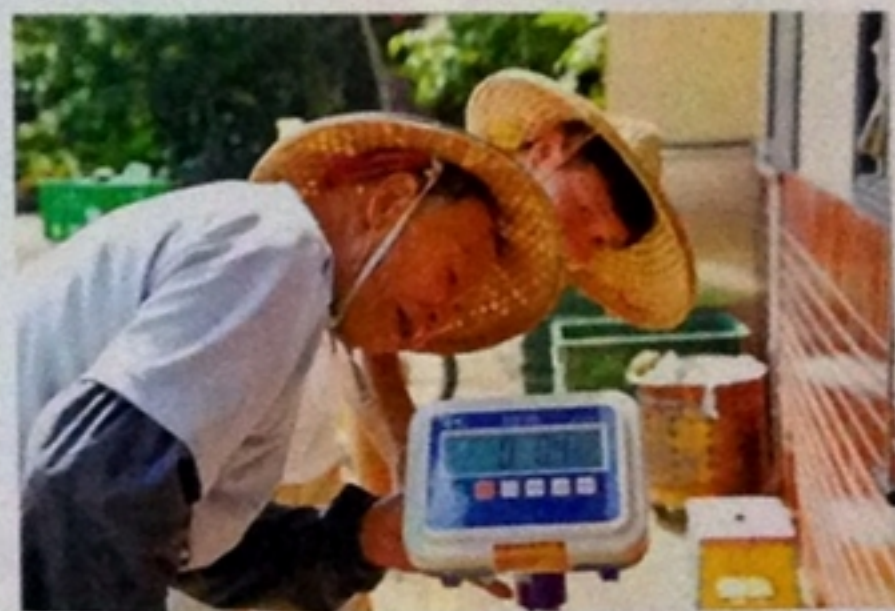
▲藍家爸爸守護八卦山土鳳梨一世情，藍家兒子為土鳳梨開創新活力。